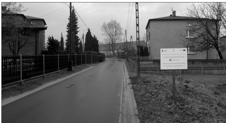
Wyremontowana ulica Podłuże

lata 2007-2013. Zakres inwestycji i dofinansowania obejmował również odbudowę zniszczeń pasa drogowego po powodzi.